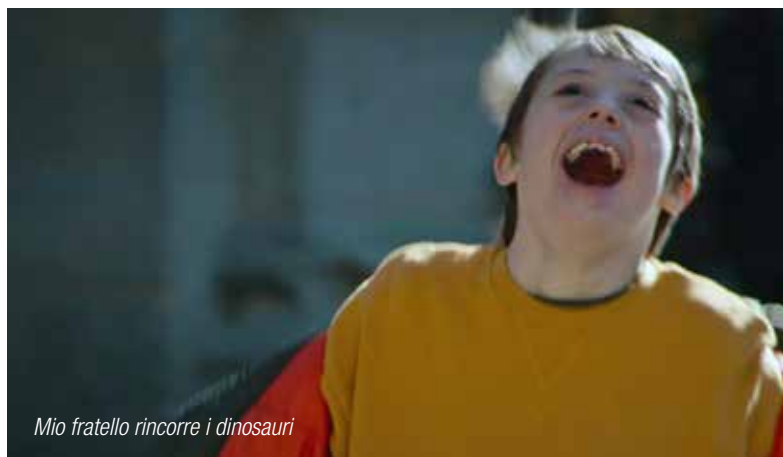
Mio fratello rincorre i dinosauri